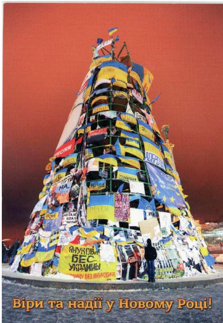
Новорічна листівка з майданівською ялинкою.

До загострення ситуації у січні 2014 року символом Майдану як місця, де збиралися культурні й освічені люди, європейці за духом, було піаніно Майдану . Його ставили перед силовиками, а відчайдушні музиканти виконували на ньому різні музичні композиції.