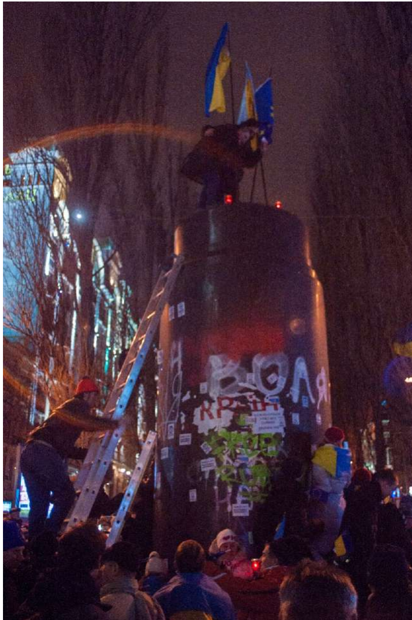
Так починався «ленінопад».

10 грудня було ініційовано перемовини у форматі круглого столу між В. Януковичем та представниками політичної опозиції. Роль умовних арбітрів мали відіграти попередники Януковича на президентській посаді – Леонід Кравчук, Леонід Кучма та Віктор Ющенко.