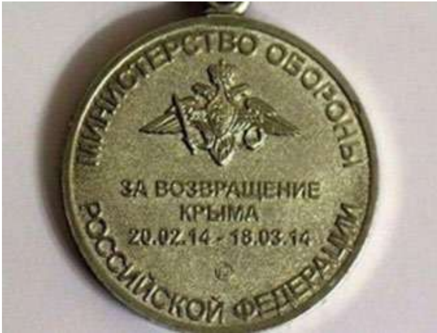
Медаль министерства обороны росії «За повернення Криму. 20.02.14 – 18.03.14»

Проте відлуння Майдану виявилось потужним: намірам росіян окупувати Кримський півострів намагалися перешкодити кримськотатарські та українські активісти. 26 лютого на ініціативу Меджлісу в Сімферополі перед будівлею Верховної Ради АР Крим відбувся мітинг, до якого приєдналися проукраїнські активісти. Їм удалося заблокувати будівлю та завадити проросійським депутатам зібрати кворум і легалізувати російську окупацію. Однак у ніч на 27 лютого будівлю кримського парламенту захопили російські військовики без розпізнавальних знаків. Почався процес «легалізації» російської окупації, який закінчився псевдореферендумом 18 березня 2014 року та анексією Криму.