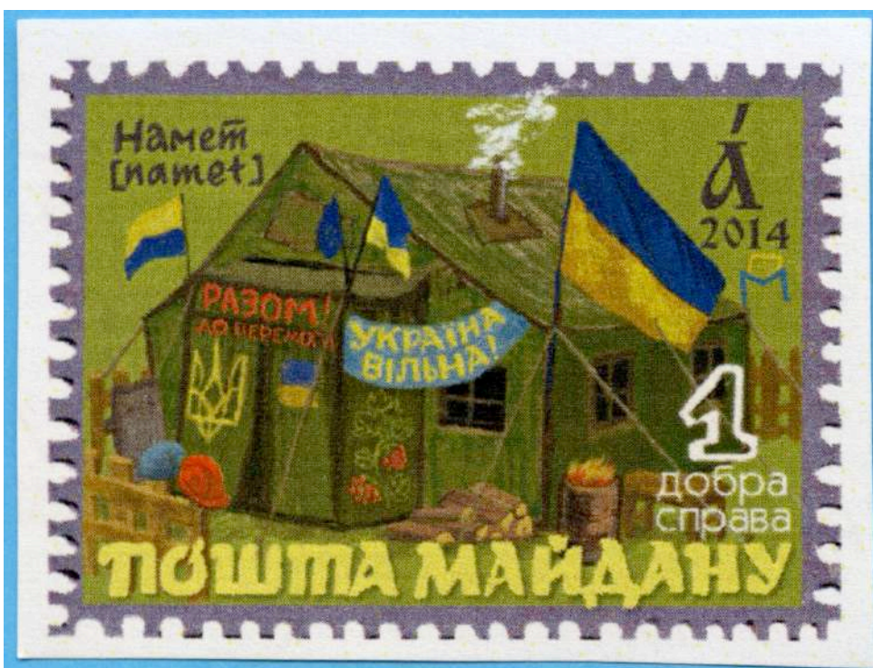
Марка «Пошти Майдану». Художниця Юлія Овчаренко. Із фондів НМРГ

● Музей Майдану – ініціатива виникла у січні 2014 року в результаті взаємодії музейників та активістів Майдану, які, розуміючи історичний масштаб і суспільне значення подій в Україні, закликали до збереження артефактів і свідчень Революції Гідності, документували події, збирали предмети та усні історії, влаштовували виставки й освітні проекти, розробили концепцію Музею Майдану / Музею Свободи, вивчали міжнародний досвід музеїв складної історії. Результатом зусиль активістів стало створення музейної інституції: 18 листопада 2015 року було видано розпорядження Кабінету Міністрів України про утворення Меморіального комплексу Героїв Небесної Сотні – Музею Революції Гідності.