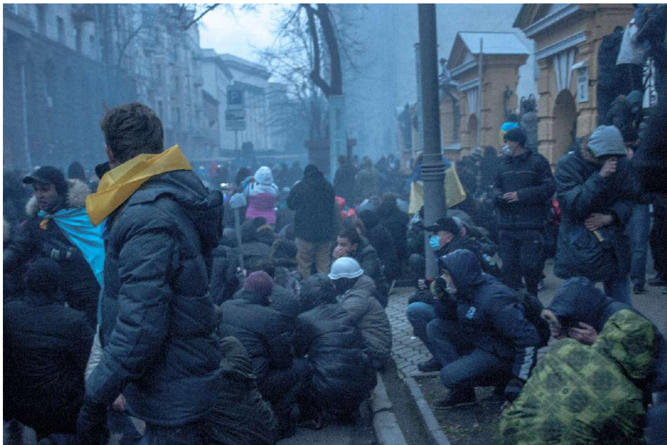
Вулиця Банкова 1 грудня 2013 року.

Цього ж самого дня протестувальники зайняли приміщення Київської міської ради та Будинок Федерації профспілок України, де розмістився новостворений Штаб національного спротиву. Рух Хрещатиком було перекрито. Там постало наметове містечко.