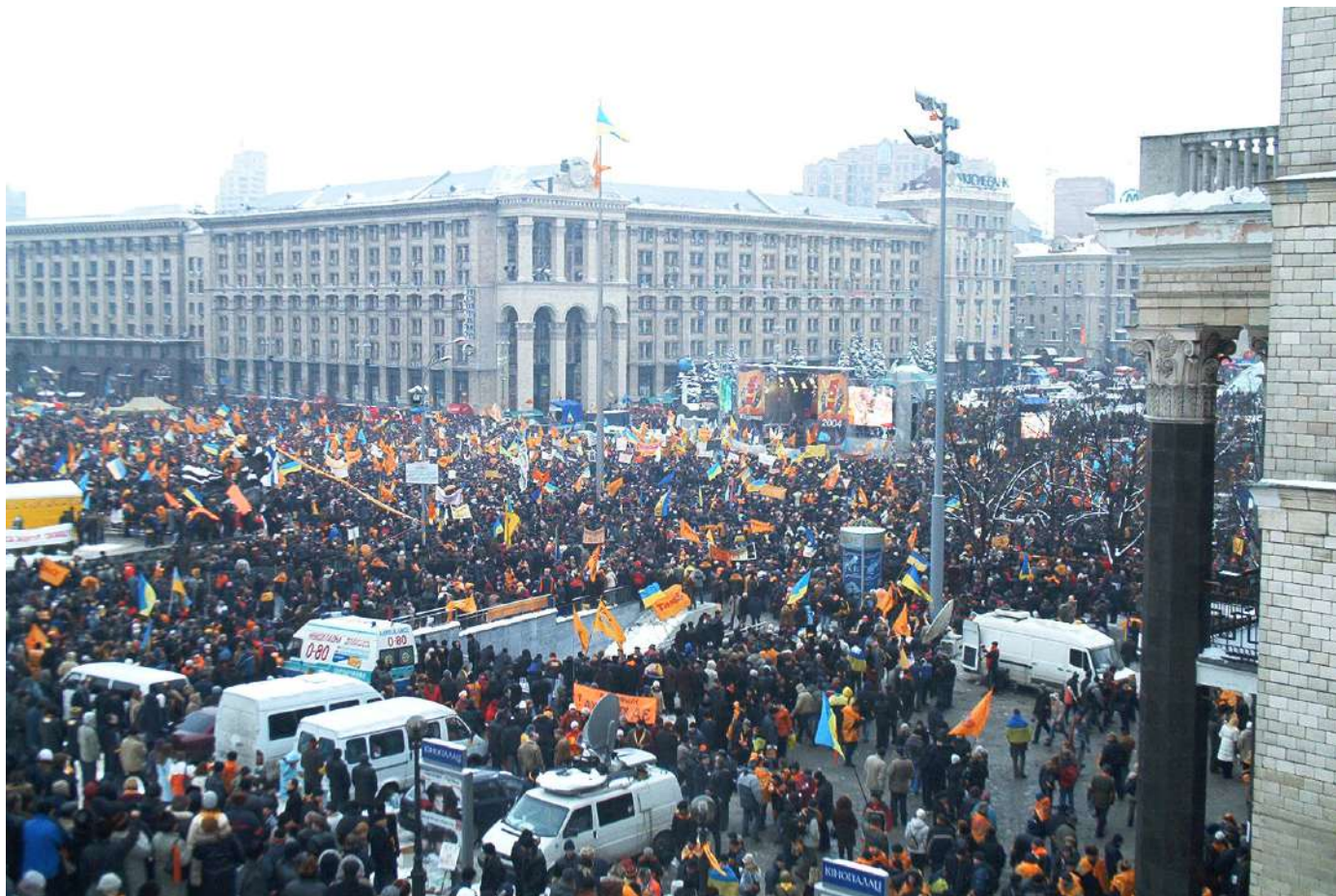
Помаранчевий майдан.