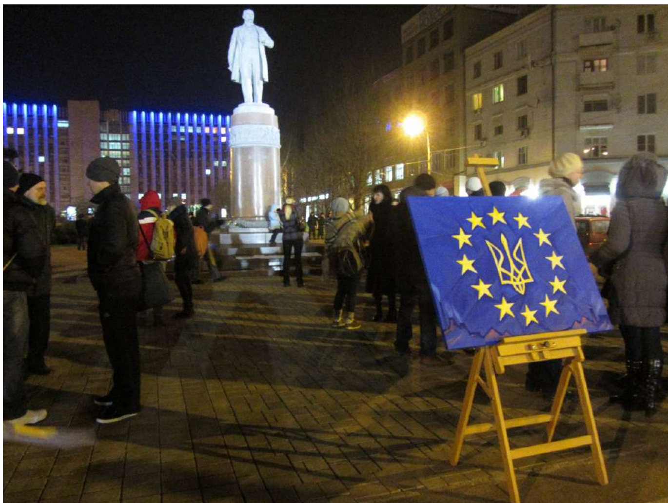
Євромайдан у Донецьку. 25 листопада 2013 року.

Акції з вимогою підписати Угоду про асоціацію з ЄС відбулися також у багатьох країнах світу, де жили українці. Зокрема українська діаспора Італії, Франції, Німеччини, Великої Британії, Чехії, Польщі, США та Канади 23–24 листопада організувала мітинги, на яких люди висловлювалися на підтримку Євромайдану та виступали за укладення Угоди про асоціацію.