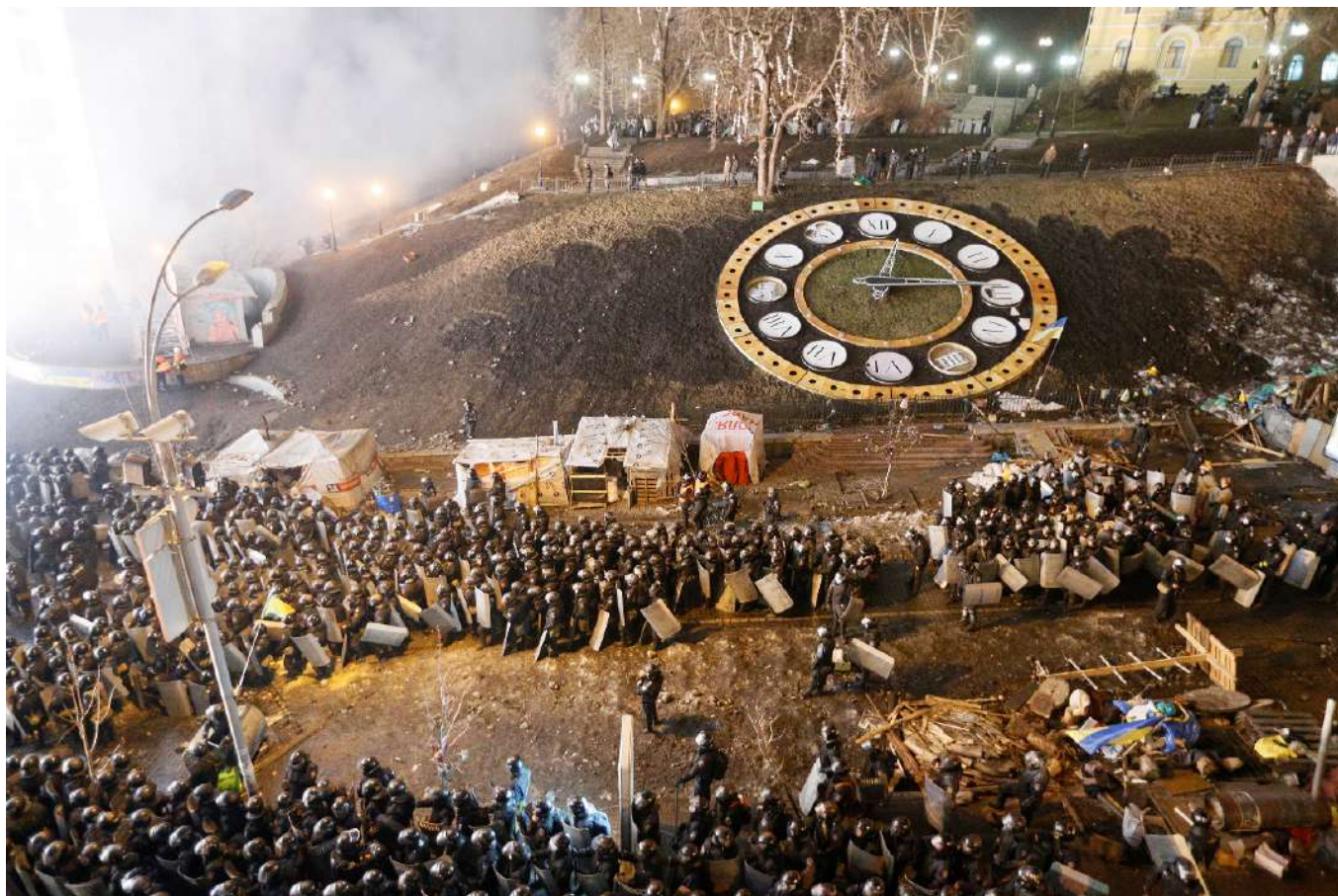
Штурм Майдану. Вечір 18 лютого 2014 року.