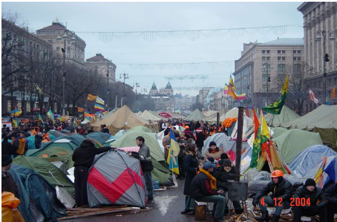
Побут протестувальників у наметовому містечку на Хрещатику.

Позачергова сесія Київської міської ради висловила недовіру Центральній виборчій комісії (ЦВК) та звернулася до Верховної Ради з проханням не визнавати попередні результати підрахунку голосів. Одночасно Київрада зобов'язала Київську міську державну адміністрацію забезпечити належні умови для проведення масових акцій у Києві та охорону громадського порядку. Того самого дня ще до оголошення офіційних результатів голосування президент росії володимир путін привітав Віктора Януковича з перемогою.