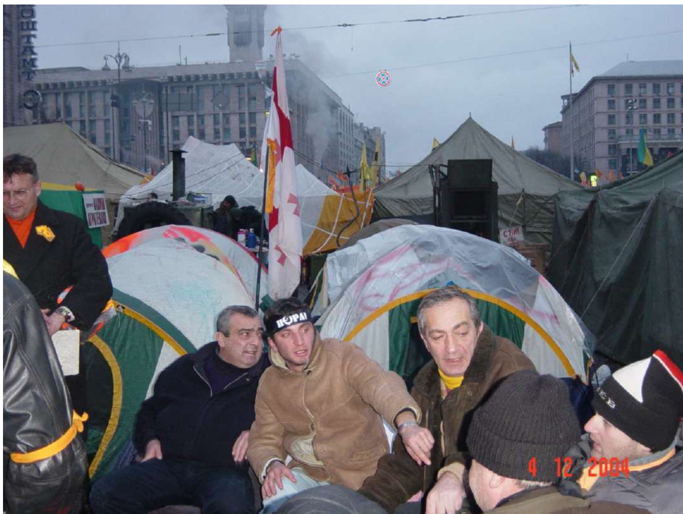
Активіст «Пори» у наметовому містечку.