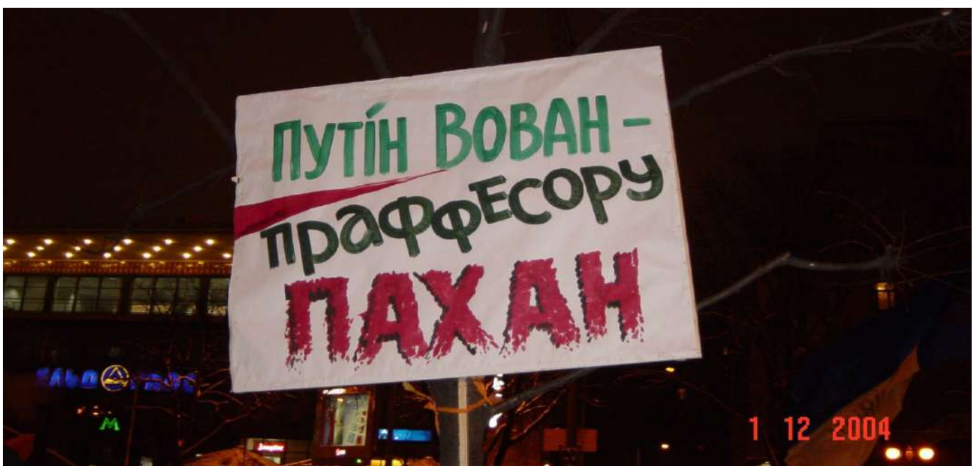
Плакат Помаранчевої революції. Світлина Олексія Ненюченка. Із колекції НМРГ

Хоча Помаранчевий майдан не мав відверто антиросійського характеру, чимало його учасників усвідомлювали, в чиїх інтересах перемога Януковича та яке майбутнє може очікувати Україну, якщо він стане чільником держави. Тому серед агітаційних плакатів можна зустріти ті, які прямо вказували на російський вплив, помітний у риториці й діях Януковича та його прибічників.