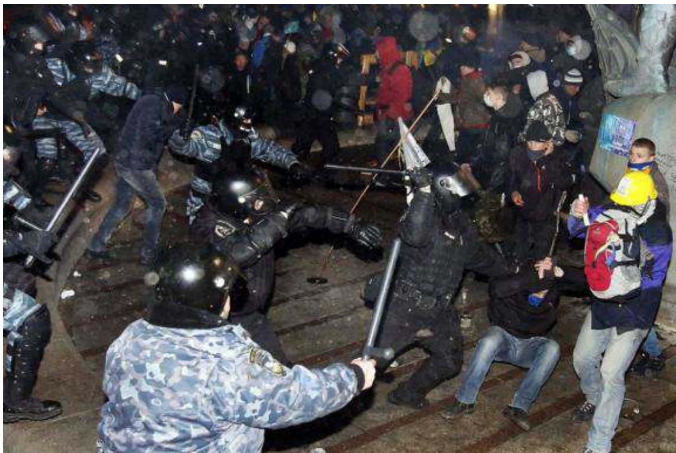
Побиття мітингувальників біля монумента Незалежності в ніч на 30 листопада 2013 року.

Офіційною причиною розгону Євромайдану назвали підготовчі роботи з установа традиційної новорічної ялинки в центрі Києва.