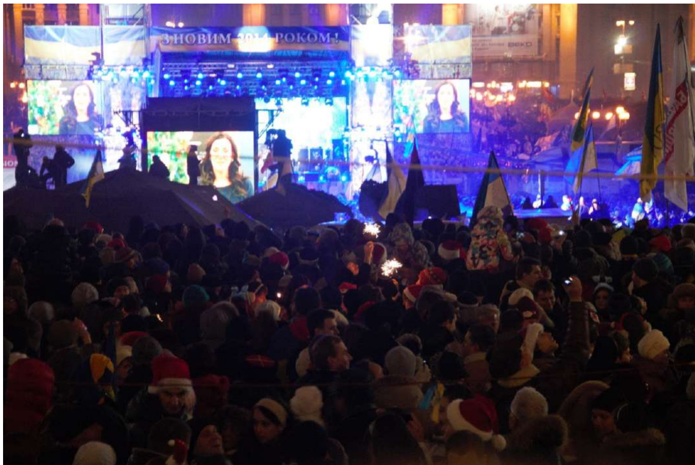
Новий рік на майдані Незалежності.

16 січня у Верховній Раді переважно силами депутатів від Партії регіонів і комуністів ухвалили пакет законів, які суттєво обмежували права громадян на протест. Суспільство відразу охрестило їх «диктаторськими». Ці закони, спрямовані проти фундаментальних громадянських свобод – свободи вияву поглядів, мирних зібрань, об'єднань, цілковито звільняли від відповідальності причетних до кривавих подій на Євромайдані та створювали правові підстави для запровадження цензури й переслідування незгодних із діями влади.