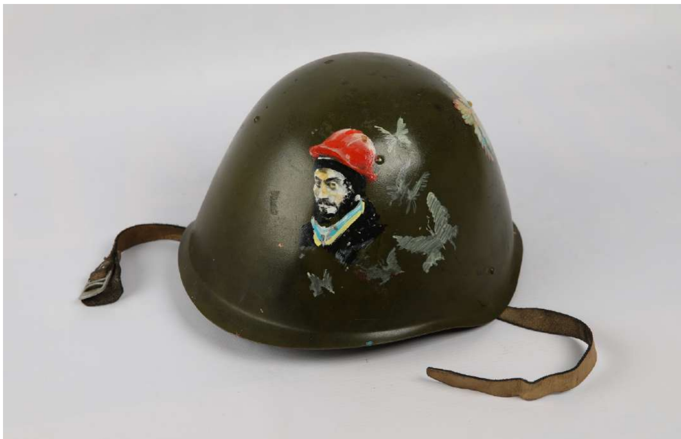
Майданівська каска з портретом Героя Небесної Сотні Сергія Нігояна.

Серед основних символів Майдану – стрічки з кольорами прапорів України та Європейського Союзу, каски та щити членів Самооборони Майдану, що не могли захистити від куль, а радше сприймалися як суто символічні засоби захисту чи як обереги. Невипадково значну кількість щитів і касок було розписано або вкрито написами.