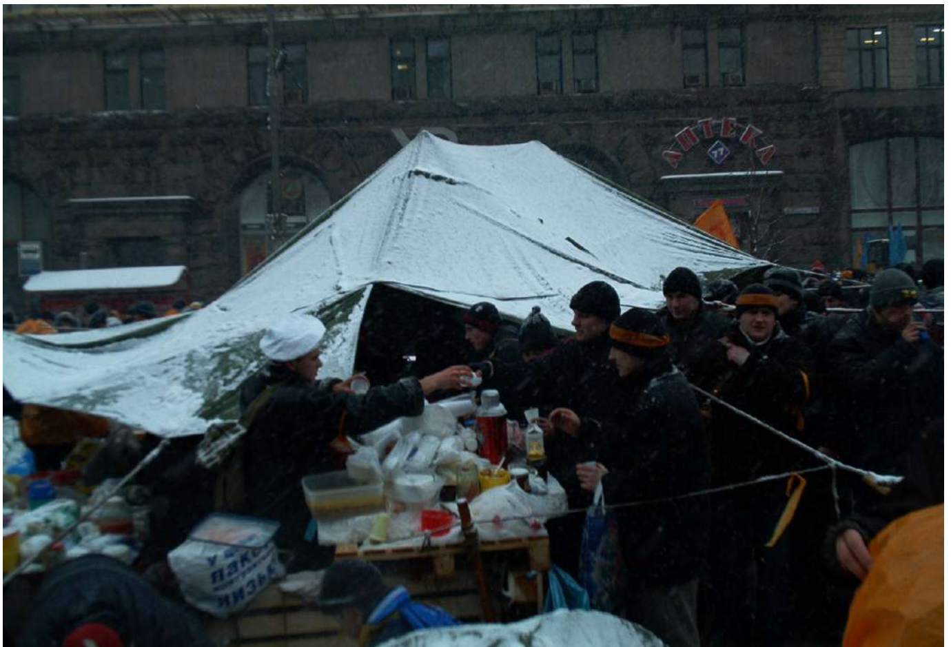
Кухня на Майдані.

Серед громадських ініціатив одну з провідних ролей під час Помаранчевої революції відіграла організація «Пора!», утворена ще на початку 2004 року з метою контролю виборчих процесів.