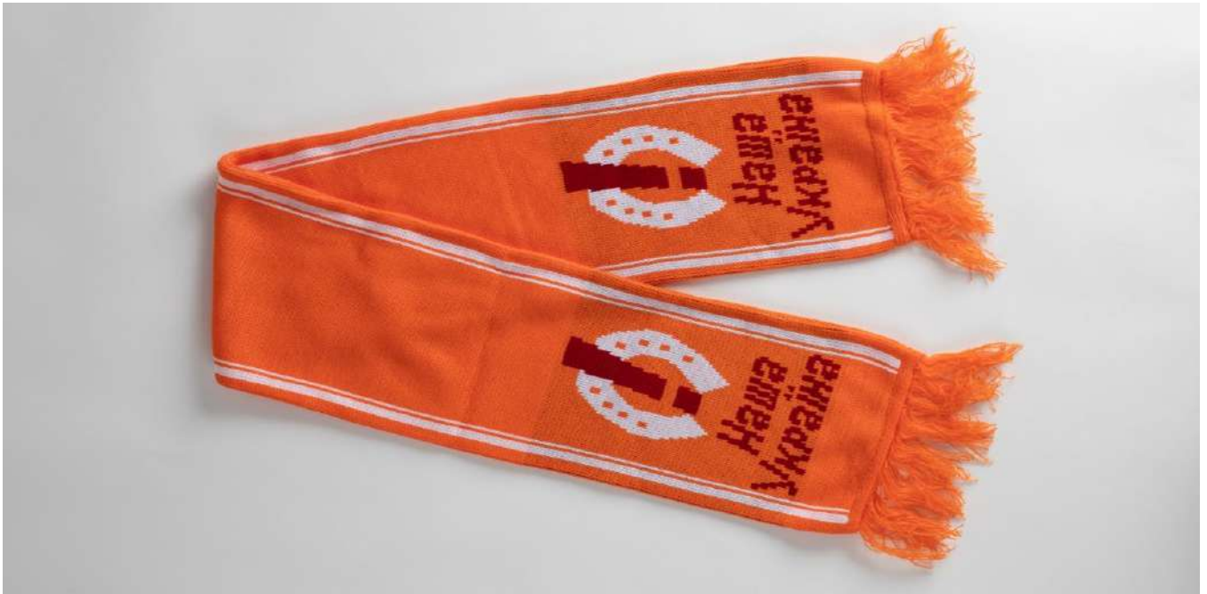
Шарф учасника Помаранчевої революції. Із фондів НМРГ