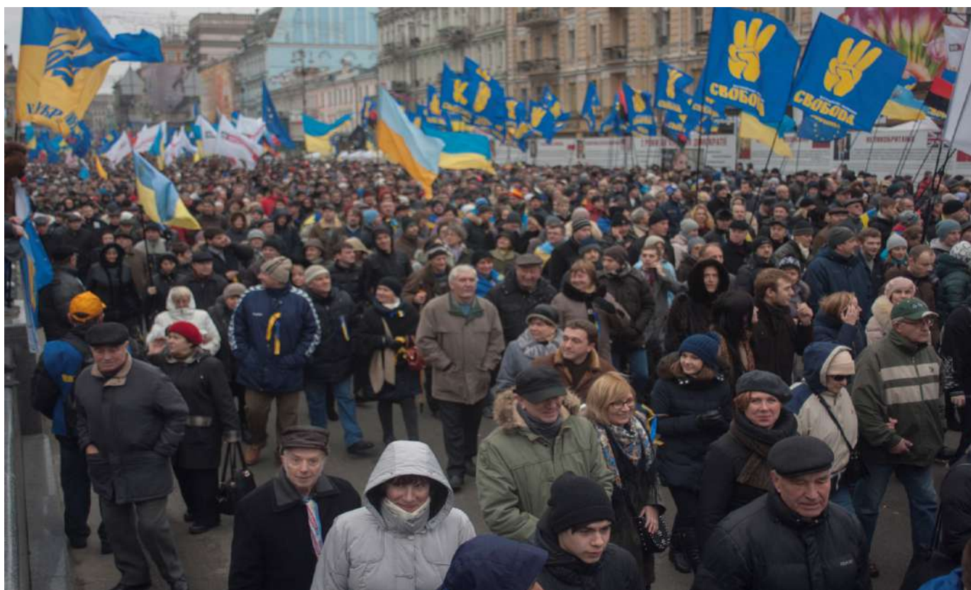
Учасники маршу 1 грудня 2013 року.

1 грудня спершу на Михайлівській площі, а потім біля пам'ятника Тарасові Шевченку в Києві почали збиратися тисячі людей. Звідти колони учасників акції маршем рушили до майдану Незалежності. За різними даними, участь у марші взяли від 500 тисяч до 1 мільйона осіб з усієї України.