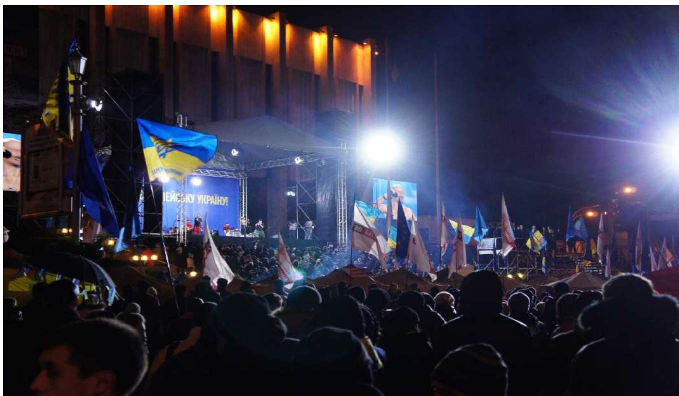
Політична опозиція на Європейській площі.

Ближче до вечора на Європейській площі постало наметове містечко прихильників євроінтеграції. Комендантом містечка було обрано Андрія Парубія. Силовики намагалися «зачистити» табір мітингувальників, почалися сутички, під час яких правоохоронців відтіснили до готелю «Дніпро».