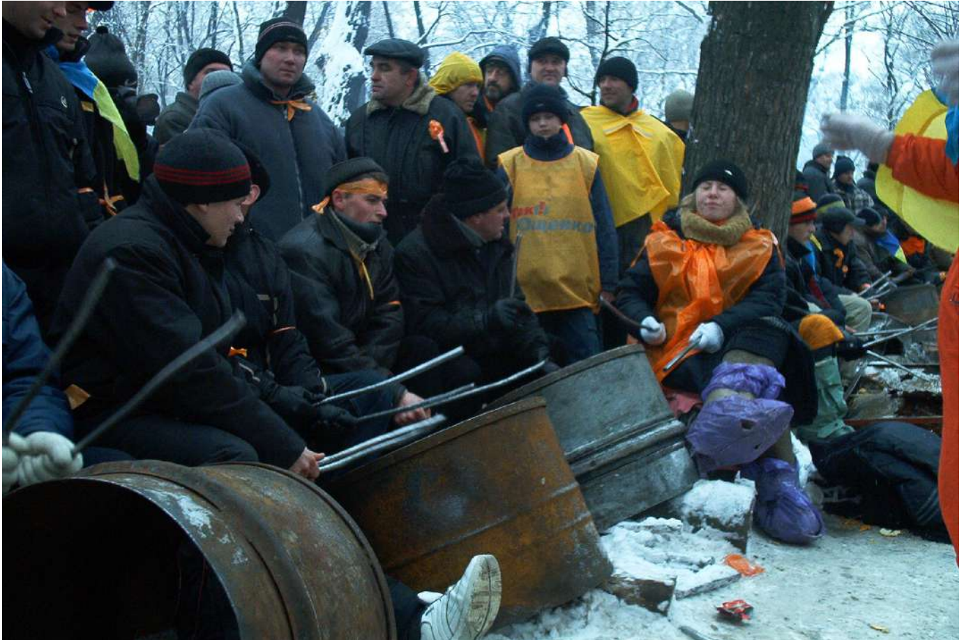
Барабанщики Помаранчевої революції.

Оригінальним виявом творчого духу Майдану стали «барабанщики революції» – група людей, які навпроти будівлі Кабінету Міністрів України стукали в металеві бочки, що залишилися в Маріїнському парку після мітингів прихильників Януковича.