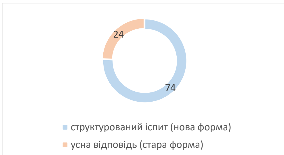
Малюнок 2. Оптимальний варіант проведення підсумкового контролю за вибором респондентів (%)

Більшість респондентів (74%) обрали структурований іспит (стандартизований усний), тобто нову форму як оптимальний варіант проведення підсумкового контролю, тоді як 24% респондентів надають перевагу усній відповіді (старій формі).