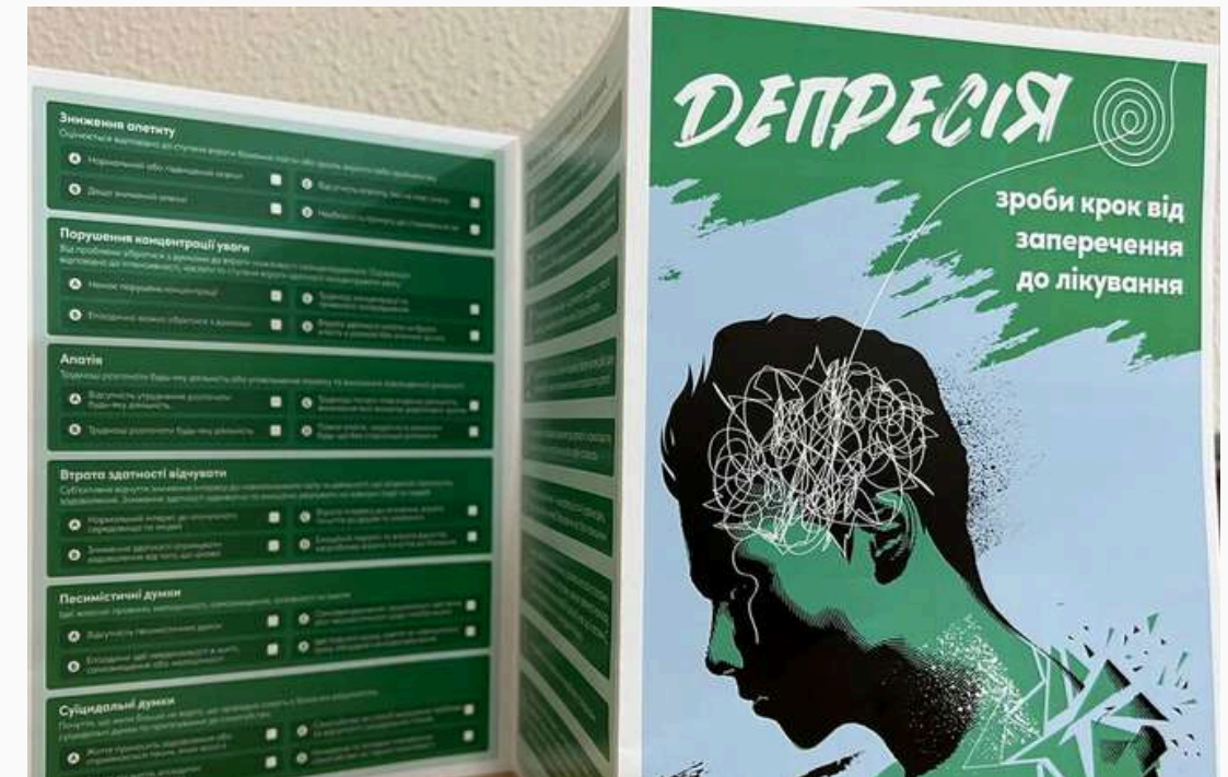
Волонтерська допомога нашим воїнам